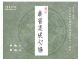
增訂叢書集成初編